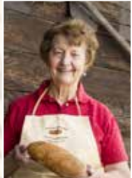
Alpenhotel Wanderniki Lesachtaler Brot

Unsere Slow Food ProduzentInnen freuen sich auf dich!