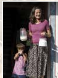
Bergbauernhof Ederhies Biowiesensmilch