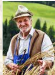
Mühlengemeinschaft M. Luggau Korn