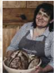
Almwellness Resort Tuffbad Lesachtaler Brot