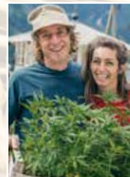
Hepi Lodge Hanf