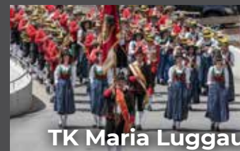
TK Maria Luggau