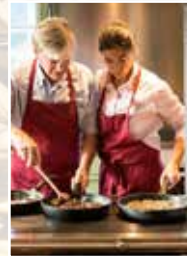
Peintnerhof Gesunde Lebensmittel