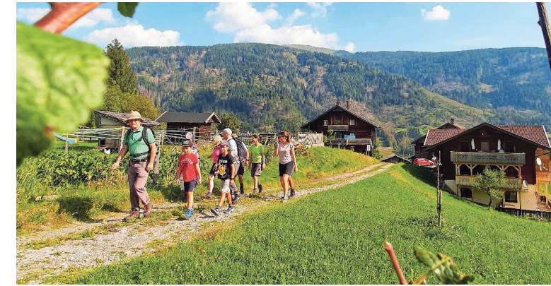
Start der Wanderung ist der Peintnerhof in Niedergail

Derart gestärkt erreicht man Dr. Wiese, wo jetzt wilde Brombeeren und rote Preiselbeeren aus dem Grün leuchten, im Sommer findet man die Tee- und Sa-